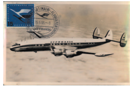
Postkarte anlässlich der Aufnahme des Europaverkehrs am 15.05.1955

Nach dem Zweiten Weltkrieg erhielt die Bundesrepublik Deutschland erst mit dem Inkrafttreten der Pariser Verträge im Jahr 1955 ihre volle Souveränität und damit auch die Hoheitsrechte über den Luftraum zurück – für die Deutsche Lufthansa war damit der Betrieb von Verkehrsflugzeugen wieder erlaubt.