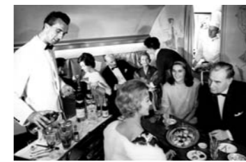
Der Erste-Klasse-Dienst „Senator“

In Deutschland stand die legendäre „Super Connie“ wie kein anderes Flugzeug als Synonym für den Aufbruch und das „Wirtschaftswunder“ in der Nachkriegszeit. Erst mit der Super Constellation entwickelte sich das Flugzeug zu einem Massenverkehrsmittel, das schnell und bequem Verbindungen zu den Wirtschaftszentren der Welt schaffte und lange Schiffspassagen ersetzen konnte.