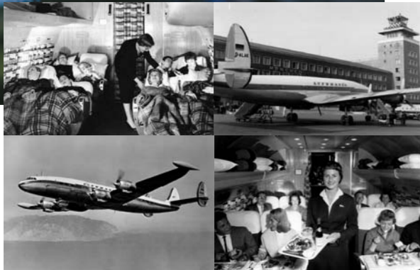
Die Lockheed L-1049 G Super Constellation: