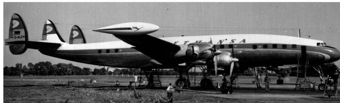
Lufthansa Super Constellation D-ALEM

Die Strecke über den Nordatlantik in Richtung New York war zunächst nur mit Zwischenstops zu bewältigen, mit Rückenwind konnte der Flug zurück nach Deutschland jedoch meist nonstop zurückgelegt werden. Für die größere Reichweite des Flugzeugs sorgten torpedoförmige Zusatztanks an den Enden der Tragflächen, so genannte Tip Tanks, mit einem zusätzlichen Fassungsvermögen für jeweils 2.200 Liter Treibstoff.