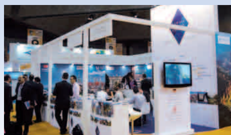
10-2011: ITB Asia (Singapore)