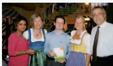
10-2011: Il vincitore di Oman Air / Evento Bavaria Press (Muscat)