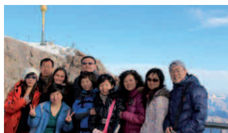
11-2011: Fam – group Air China sullo Zugspitze