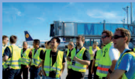
09-2011: Star Mega Do in vista all'aeroporto di Monaco