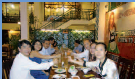
08-2011: Cena re-union Fam-Trip – (Ho Chi Min)