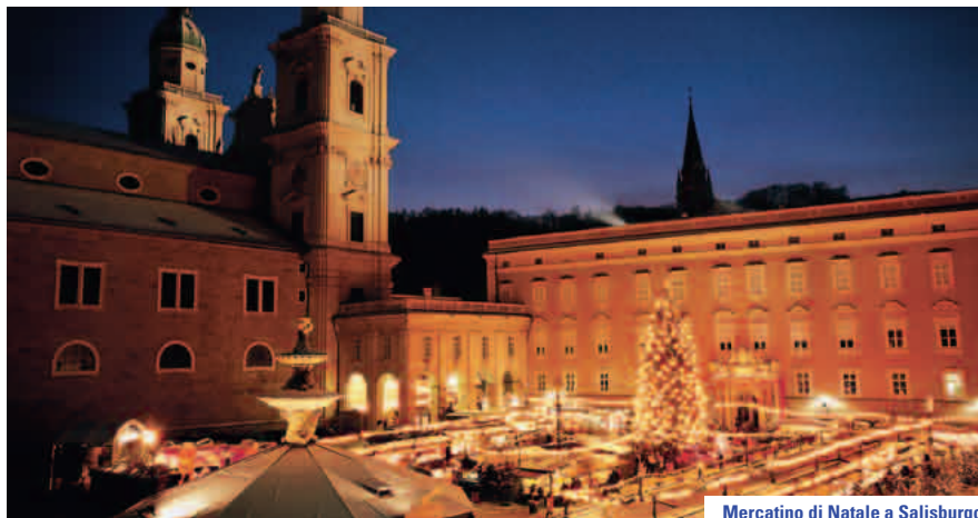
Mercatino di Natale a Salisburgo

Con il Bayern-Ticket, una proposta della "Deutsche Bahn" (ferrovie tedesche), gruppi fino a 5 persone possono visitare tutta la Baviera a soli 29 Euro per tratta. Il biglietto è limitato ai treni regionali e offre l'opportunità di visitare anche Salisburgo, città austriaca sul confine tra Germania e Austria. Il Bayern-Ticket è il modo più conveniente di unire una gita a Salisburgo a una visita a Monaco.