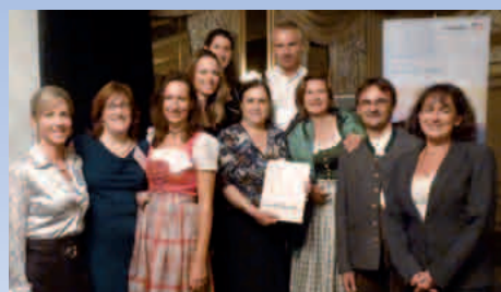
09-2011: La vincitrice del bavaria Trip (Montreal)