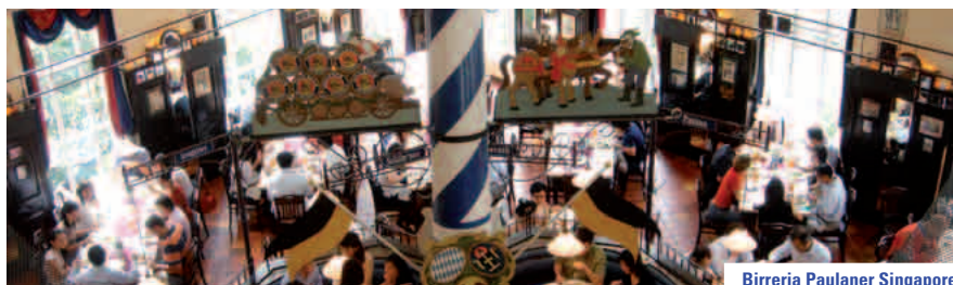
Birreria Paulaner Singapore

Il birrificio Paulaner di Monaco ha una storia di 375 anni costellata di successi cui deve la sua progressiva espansione e le oltre 20 birrerie con cucina in Germania, Cina, Singapore, Sudafrica, Russia e Taiwan.