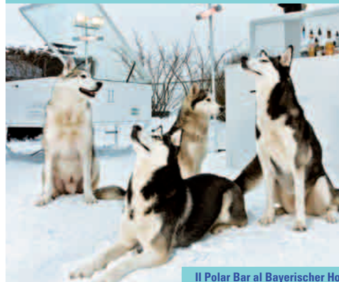
Il Polar Bar al Bayerischer Hof

Monaco è una meta turistica tutto l'anno e vale sicuramente la pena di visitarla anche durante l'inverno. Ecco uno dei programmi suggeriti per una perfetta giornata invernale a Monaco: